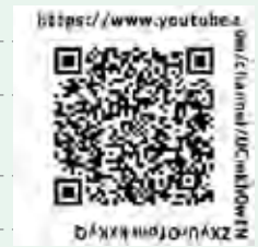
【動画配信チャンネル】

今の状況の中で、出来ることを出来るように工夫しながら行っております。皆さま方のご希望をどしどしお寄せ下さい。