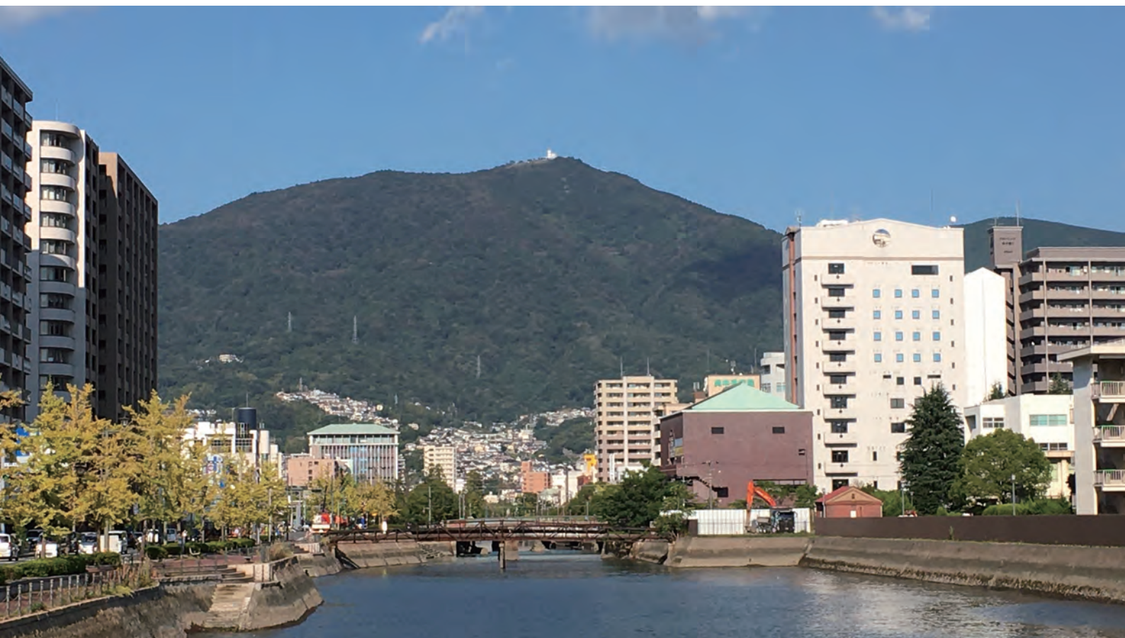
呉港近くから望む“灰ヶ峰”

平和で毎日が明るく 天候も穏やかで 災害や病気の流布もなく 国が栄え国民が安心して暮らし 争いもなく徳を尊び 人を思いやり礼儀正しい そんな世の中になりますように